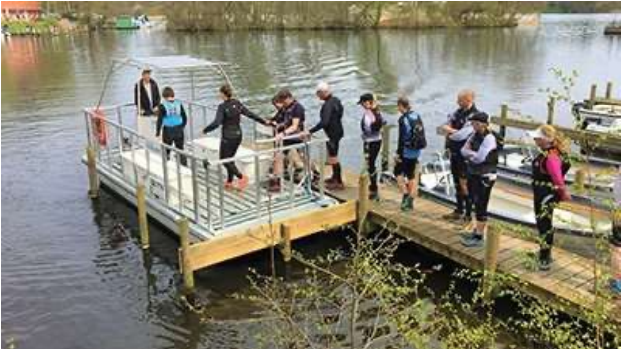
Soldrevet pram på Skyttehuset Camping