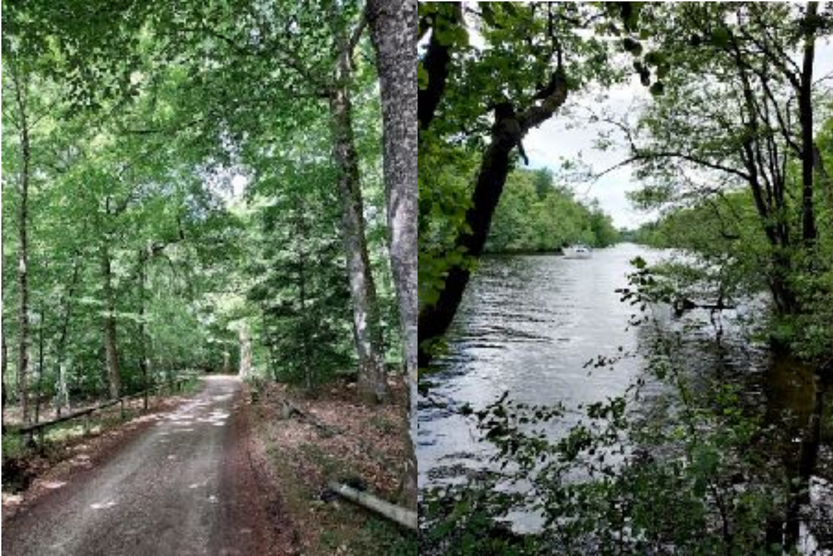
Begge foto: På vej fra Små fisk i Sejs til Silkeborg havn