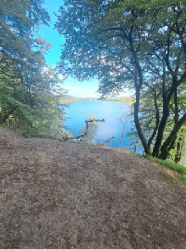
Begge foto: Almind sø syd