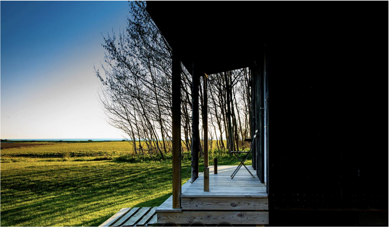
Udsigt fra en af hytterne