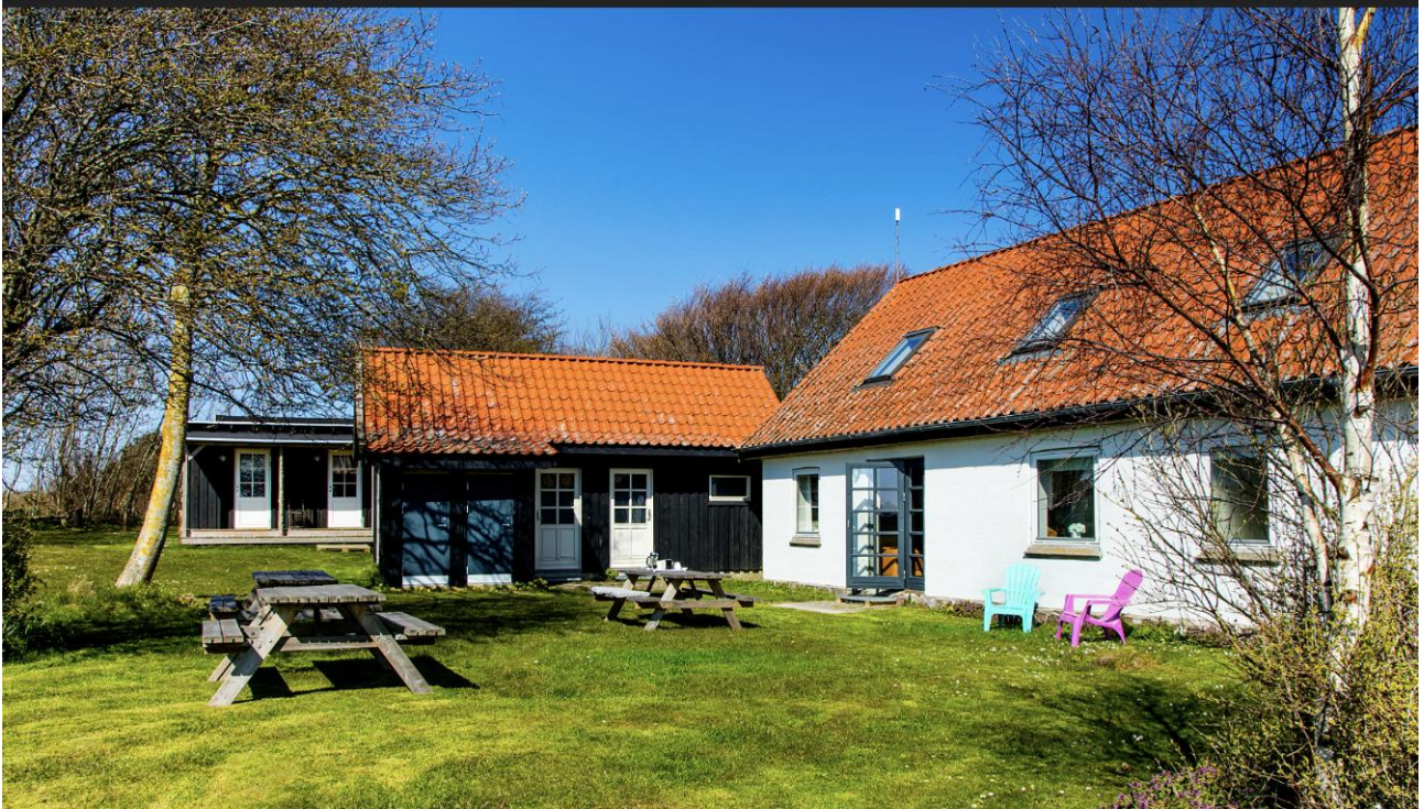
Lejrskolen set fra haven