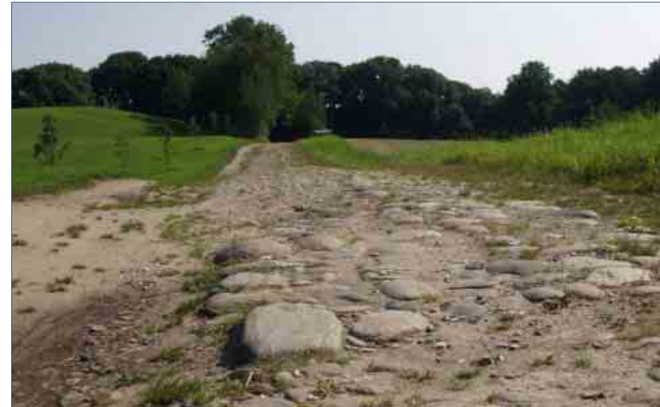
Stenbrolagt vej ved Skærsø

Det er altid en speciel oplevelse at vandre ad de gamle banestier, der slynger sig i store bløde buer gennem landskabet eller som snorlige spor så langt øjet rækker – og hele tiden i det samme eller næsten samme plan. Man er ikke i landskabet på helt samme måde, som når man går ad gamle veje og stier der følger terrænet.