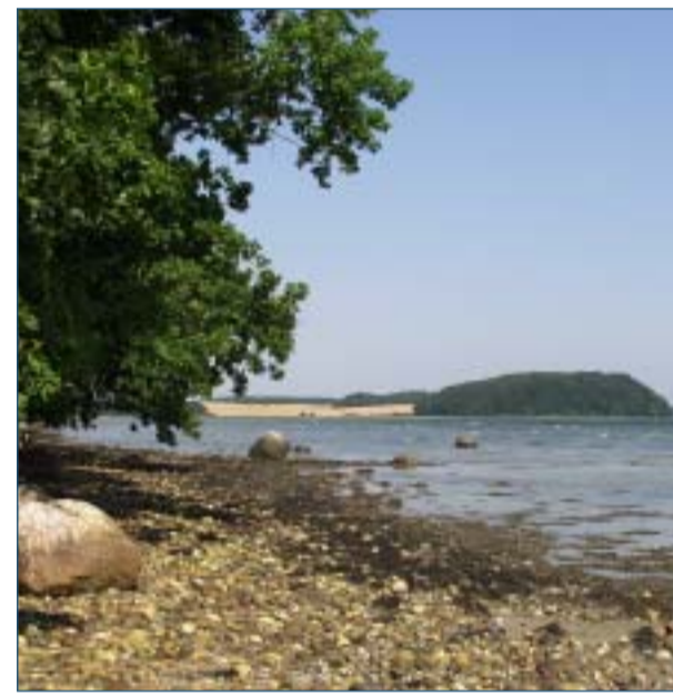
I baggrunden Vosnæsgård

Engang var stier noget der opstod, hvor folk gik, og så længe de blev brugt var de en del af landskabet. Fra Havskov ned til Studstrup følger vandreruten en gammel »naturgroet« sti, som ikke har noget navn og hvis historie ingen kender, men som er der, fordi folk har haft behov for at kunne gå der.