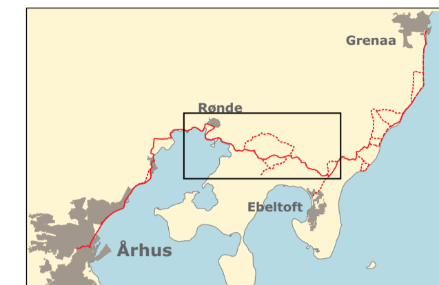
Kulturhistorie 5, Landskabet, 2005.