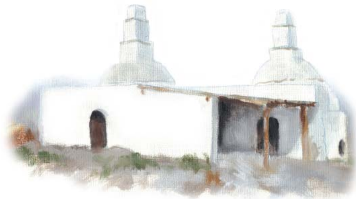
Kalkovne ved Birkesig