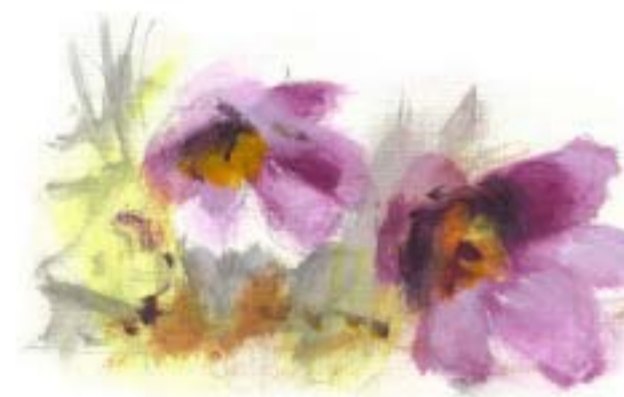
Nikkende kobjælde, Glatved Strand

usædvanlig regnfattigt, og i de tørre klitter kan temperaturen om sommeren godt snige sig op over 50 grader ved sandets overflade.